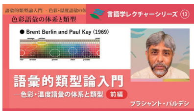
言語学レクチャーシリーズ Vol. 13 「言語学的類型論入門—色彩・温度語彙の体系と類型—」 ブラシャント・バルデシ

また、「総研大日本語言語科学特別講義シリーズ」も配信中です。このシリーズは、国立国語研究所の総合研究大学院大学日本語言語科学コースの特別講義で、国内外の第一線で活躍する研究者が、日本語学・言語学・言語処理・日本語教育研究など、幅広い分野について講義を行っています。2026年2月6日現在6本の動画が公開されており、こちらも毎年新しい教材が制作されています。