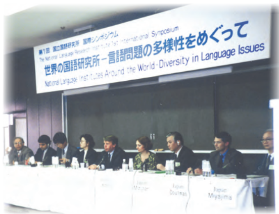
第1回国際シンポジウム（平成6年開催）