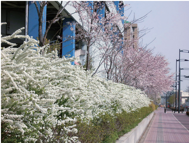
立川西大通り沿いの桜

編集 国立国語研究所普及広報委員会 「国語研の窓」部会 〒190-8561 東京都立川市緑町3591-2 電話 042-540-4300 FAX 042-540-4334 URL http://www.kokken.go.jp/